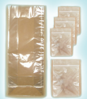
Celofán De Envolver y Bolsas Plásticas