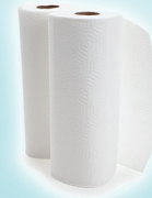
Toallas De Papel