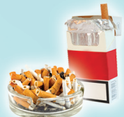
Colillas De Cigarrillo y Sus Envolturas