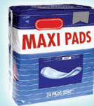
Toallas Maxi y Sus Envolturas