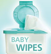
Pañitos Para Bebés