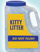
Arena Para Gatos