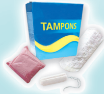
Tampones, Aplicadores, Toallas Sanitarias