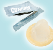
Condomes y Sus envolturas