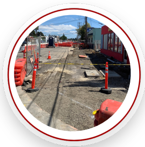
Corner of Pacific Ave and Middlefield Road. Spring 2022 / Esquina de Pacific Ave y Middlefield Road. Primavera 2022