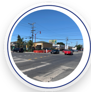
Dumbarton Ave and Middlefield Road. Current layout 2022 / Dumbarton Ave y Middlefield Road. Diseño actual