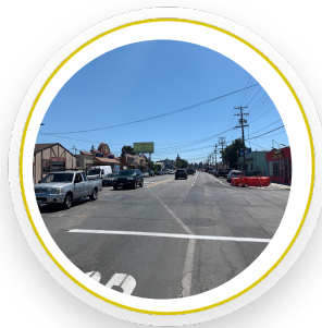
Corner of Pacific Ave and Middlefield Road. Current layout / Esquina de Pacific Ave y Middlefield Road. Diseño actual