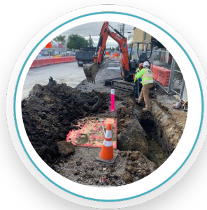
Dumbarton Ave and Middlefield Road. Spring 2022/ Dumbarton Ave y Middlefield Road. Primavera 2022