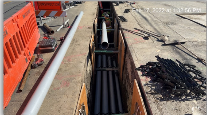
Joint Trench: moving utilities conduits underground Zanjas de articulación: conductos de utilidades subterráneos