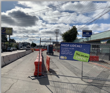
Business are open during construction Los negocios siguen abiertos durante la construcción