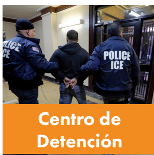
Centro de Detención