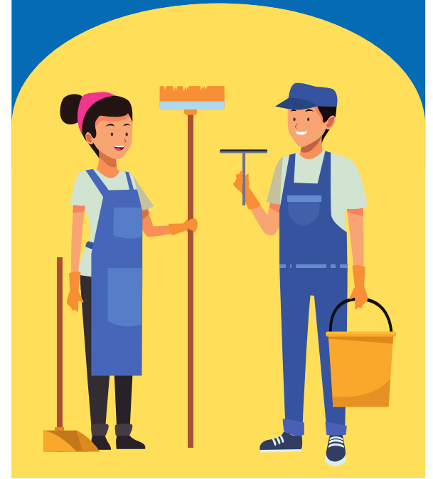
Mga manggagawa sa County ng San Mateo: